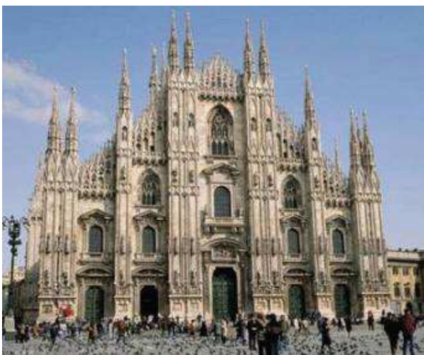
Foto: El Duomo

Después haremos una parada para almorzar en restaurante concertado luego volveremos a Milán para comenzar nuestra Visita panorámica con guía local . De esta bella ciudad, cabe destacar su conocida Plaza del Duomo, la Galería Vittorio-Emanuele y la Plaza de la Scala.