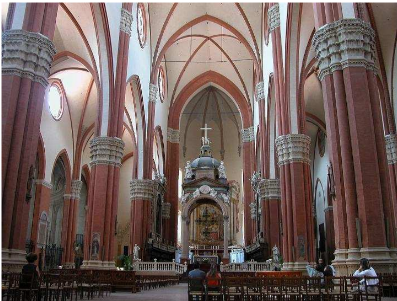
Foto: Basílica de San Petronio

Finalizada la visita parada para el almuerzo concertado en restaurante.