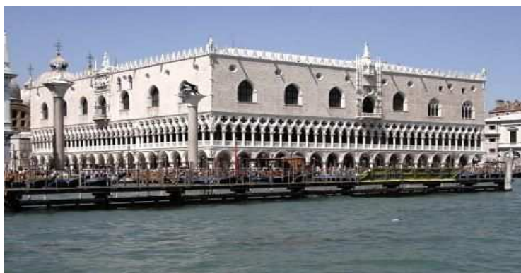
Foto: Palacio Ducal

En donde podremos disfrutar de las vistas del Palacio Ducal y La Plaza San Marcos acompañados por un guía local .