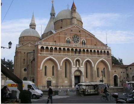
Foto: Basílica San Antonio de Padua

Después de la visita haremos una parada para Almorzar en restaurante concertado y continuación hasta Padua (82Km) , una vez allí comenzaremos la Visita de la ciudad y misa concertada (pendiente confirmación) .