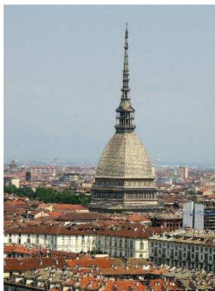
Foto drcha. Cúpula de una de las catedrales de la ciudad.